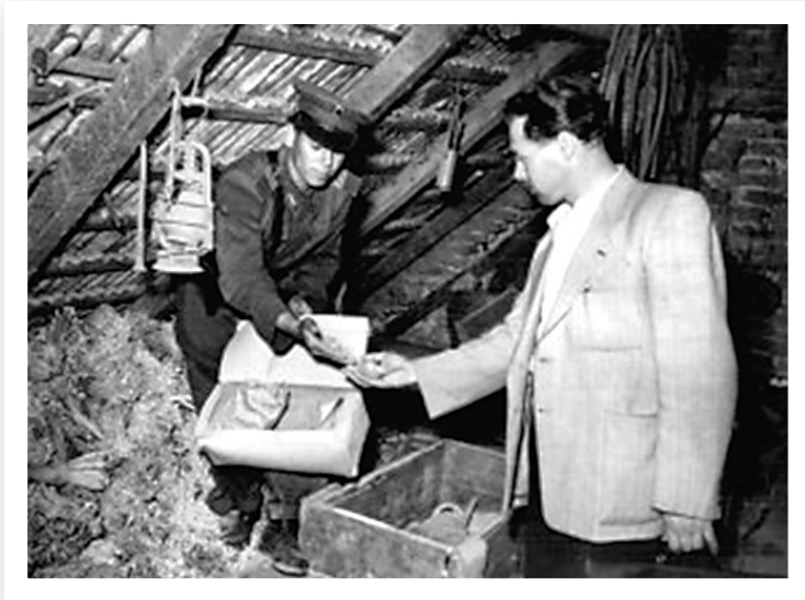
Kutatás egy padláson

A Kádár-korszakban számos népjóléti intézkedés született, 1967-ben például bevezették a gyermekgondozási segélyt (gyes). A nők gyermeküket 3 éves koráig otthon nevelhették, s ezért az anya szerény állami támogatásban is részesült.