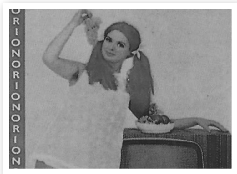
Az 1960-as években egyre több háztartásban volt TV

belül 6500 községi és egyházi iskola került állami tulajdonba. Az 1950-es évektől kezdve a felső tagozaton és a középiskolában minden diáknak kötelezően tanulnia kellett az orosz nyelvet. Az 1960-as évek közepén a huszonévesek 15 százaléka járt egyetemre, főiskolára. Ez az arány európai összehasonlításban meglehetősen alacsonynak számított, de sok munkás- és parasztfiatal számára jelentett felemelkedést.