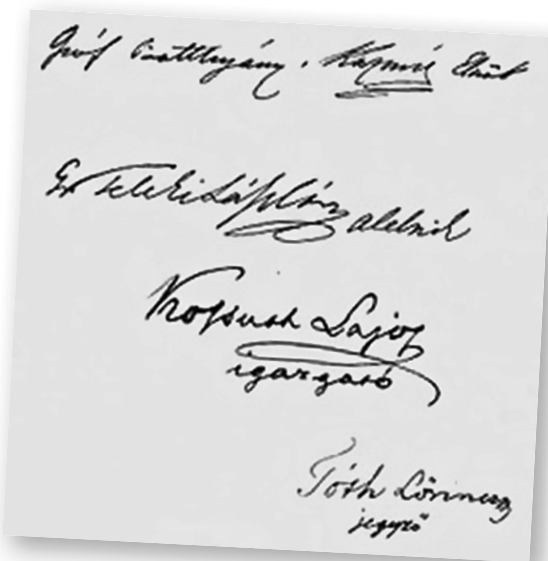
A Védegylet alapítóinak aláírása

Magyarország 1825 és 1867 közötti története két nagyobb szakaszra bontható, a szakaszhatárt az 1848/1849-es forradalom és szabadságharc jelenti. Az 1825 és 1848 közötti időszak Magyarország történetében a reformkor. Az 1849-es világosi fegyverletétel utáni megtorlást Ferenc József önkényuralma követte. Ezt az időszakot elhidegülő viszony jellemezte a bécsi udvar és a Magyar Királyság között. Változást az a felismerés hozott, hogy az osztrákok és a magyarok kölcsönösen egymásra vannak utalva Európában. Ennek hatására megkezdődött a közeledés, amelynek eredményeként 1867-ben megszületett az osztrák–magyar kiegyezés. A reformkor fontos célkitűzései közé tartozott a gazdasági élet fellendítése, az iparfejlesztés támogatása. Magyarországon ugyanis az ipar nem játszott fontosabb szerepet, a bevételek nagy része a mezőgazdaságból származott. Ezt bizonyítja, hogy az 1830-as években tíz emberből kilenc élt mezőgazdaságból. Kossuth Lajos többedmagával felismerte, hogy „ipar nélkül a nemzet félkarú óriás”, ezért önálló nemzeti ipart kell teremteni. Ezt a célkitűzést szolgálta a Védegylet megalapítása is.