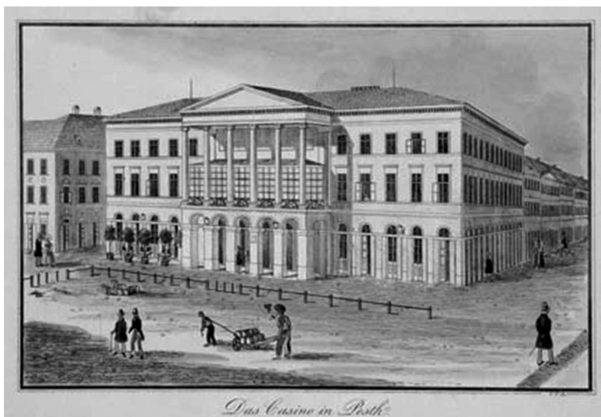
Das Casino in Pesth.

Széchenyi Istvánnak nemcsak a politikai, de a hazai kulturális élet is sokat köszönhet. Angol mintára meghonosította a lóversenyeket, 1827-ben Pesten megalapította a Nemzeti Kaszinót, hogy előmozdítsa az arisztokraták közötti politikai párbeszédet. Pest-Budát szerette volna az ország gazdasági és szellemi központjává tenni, a Budapest szót is ő használta először.